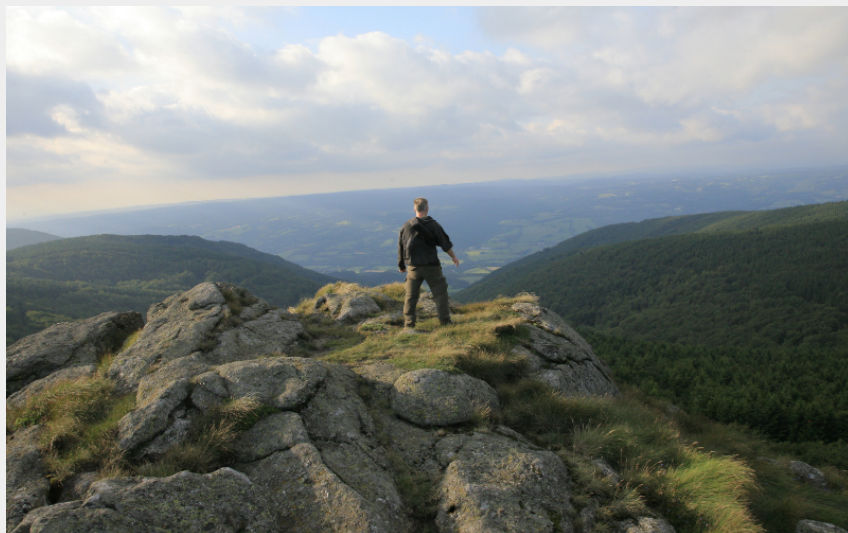
Roc de peyremaux