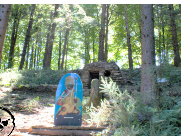
L'église de Saint-Amans-Valtoret à l'automne