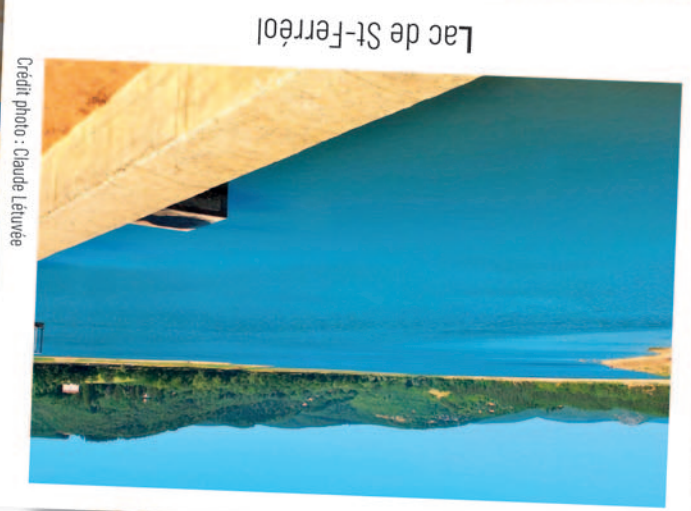
Lac de St-Ferréol