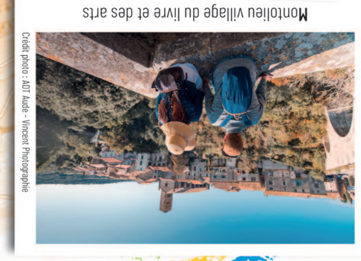
Montolieu village du livre et des arts