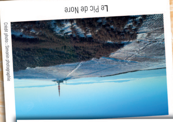
Le Pic de Nore