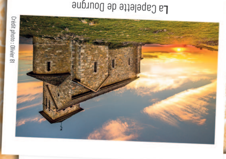
La Capelle de Dourgne