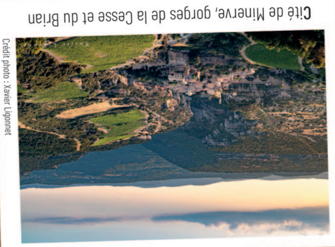
Cité de Minerve, gorges de la Cesse et du Brian