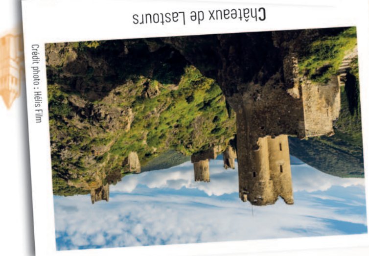
Châteaux de Lastours