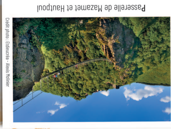
Passerelle de Mazamet et Hautpoul